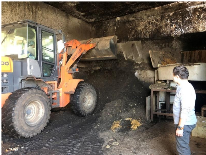
⑥原料とチップ等の攪拌状況