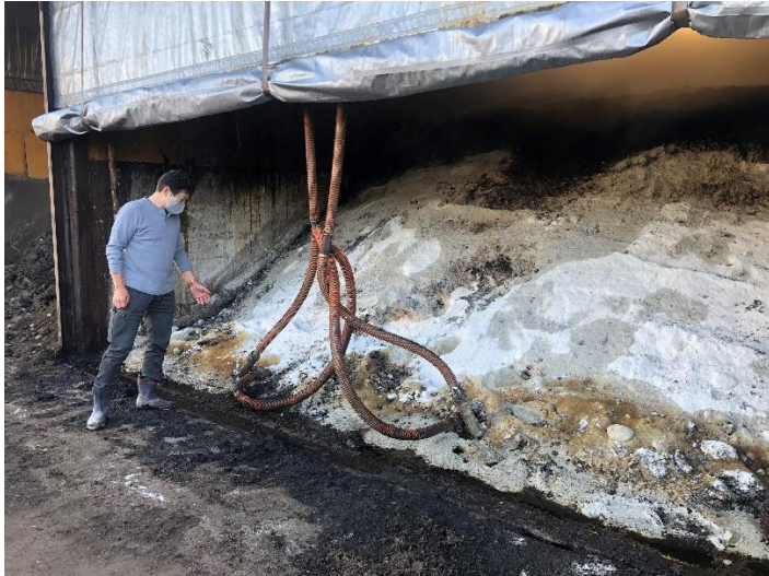
⑦発酵ヤード(ホースは高圧ブロアーのエアレーション)