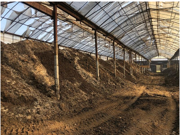
⑪堆肥ストックヤード (株ビーテック)