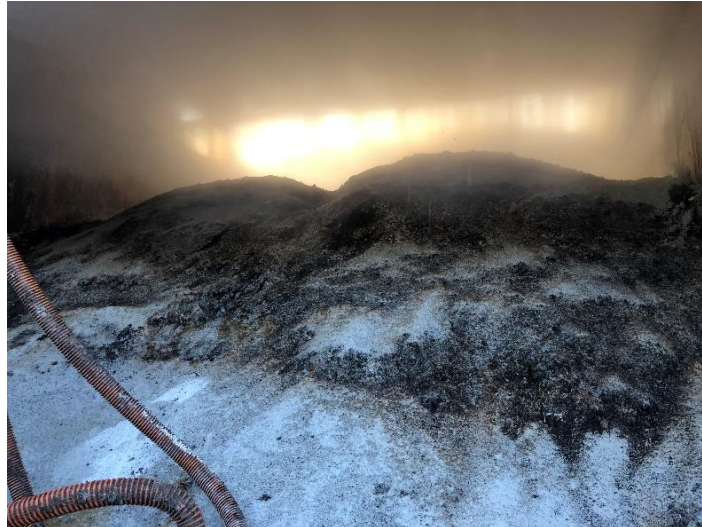
⑧発酵ヤード (発酵中)