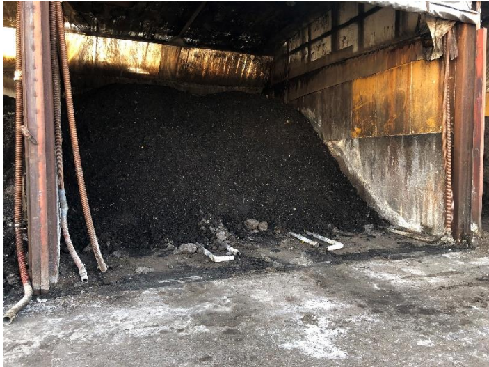
⑨発酵ヤード (完成間際)